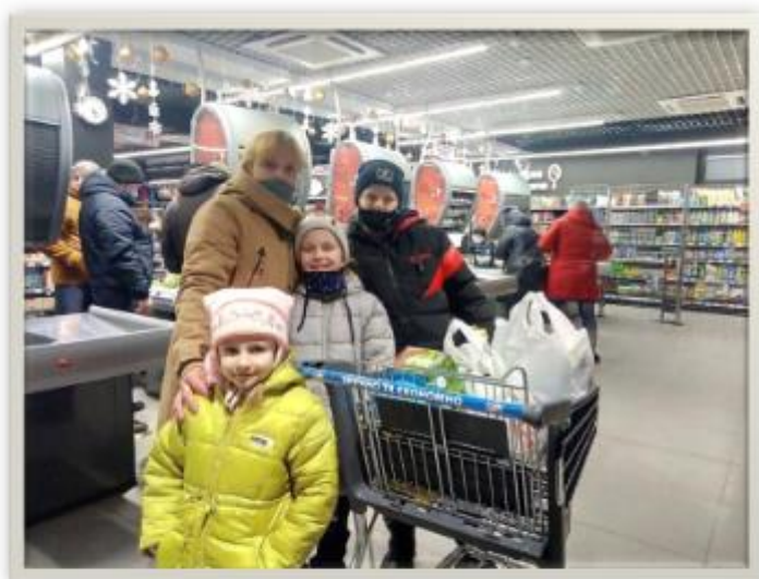
Paquetes sociales para 4 familias en Gorodnia