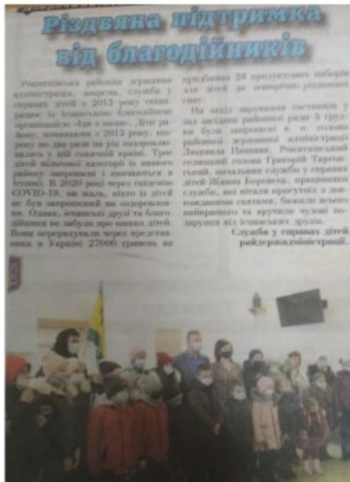
Paquetes sociales Rokitne