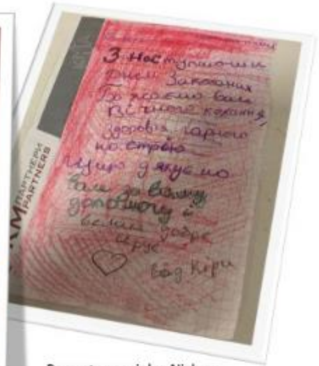
Paquetes sociales Nizhym