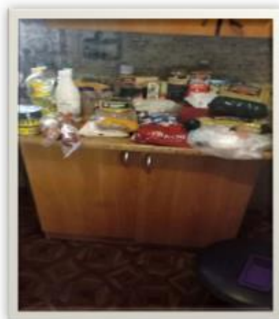
Paquetes sociales Nizhym